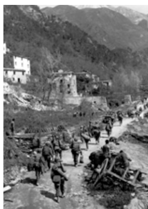
Sopra Montignoso (aprile 1945): soldati afro-americani e Nisei in marcia verso la Linea Gotica.

Il Museo di Montignoso è ospitato a Villa Schiffe e si articola in cinque sale espositive: due raccontano - attraverso fotografie, manifesti e documentazione cartacea - la guerra sul fronte italiano, dallo sbarco in Sicilia allo sfondamento della Linea Gotica sul versante tirrenico. In una terza sala un plastico riferisce il lungo elenco delle vittime civili e dei partigiani caduti; nella quarta, attraverso 8 monitor audiovisivi, si possono ascoltare le testimonianze dirette dei cittadini di Montignoso. L'ultima stanza mostra reperti di guerra conservati in apposite teche. Apertura a cura della sezione ANPI di Montignoso: aperto martedì e giovedì (10:00-12:00), gli altri giorni su prenotazione; tel. 0585.8271204 (Ufficio Cultura di Montignoso).