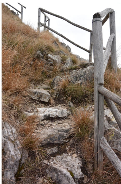
Foto 7 e 8. Tratti di sentiero ripidi e dissestati lungo l'itinerario di visita in discesa