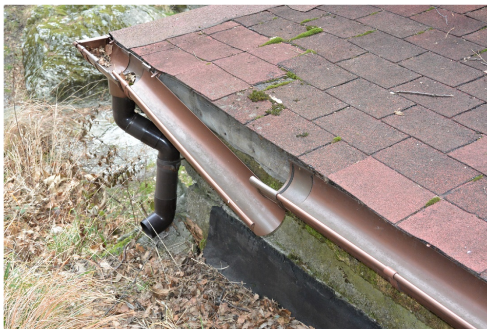
Foto 11. Condizioni delle canale sul tetto del rifugio-laboratorio che convogliano l'acqua alla sottostante zona umida