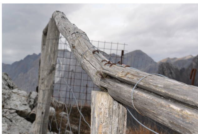
Foto 10. Tratto di staccionata degradato in vetta