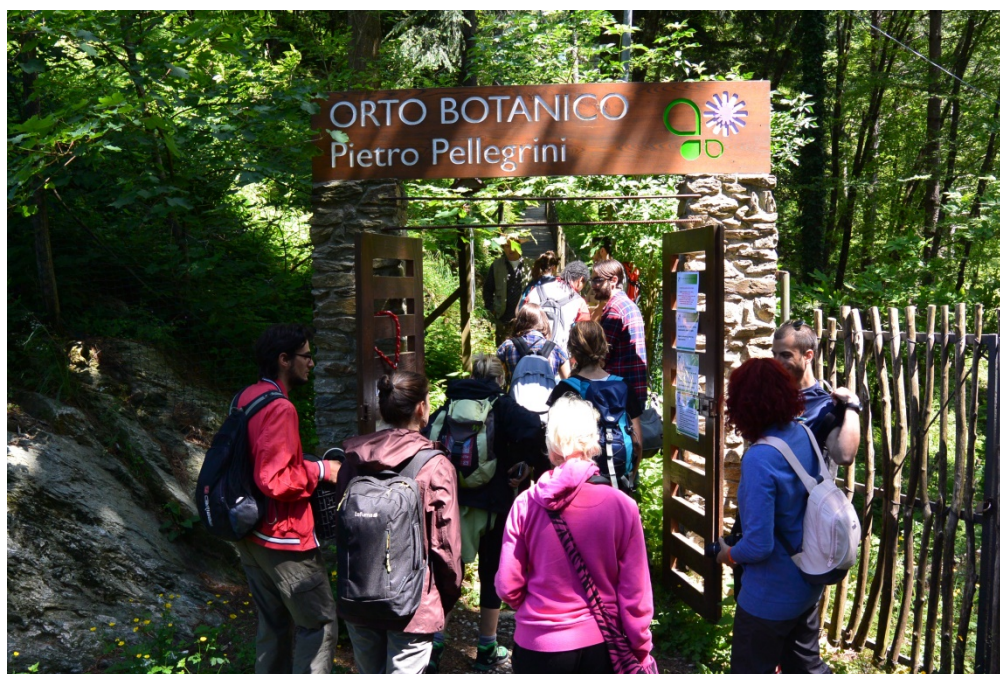
Foto 1. Ingresso dell'Orto Botanico nel piazzale di Pian della Fioba

Valorizzazione e messa in sicurezza dell'itinerario di visita dell'Orto Botanico delle Alpi Apuane "Pellegrini-Ansaldi", a Pian della Fioba (MS).