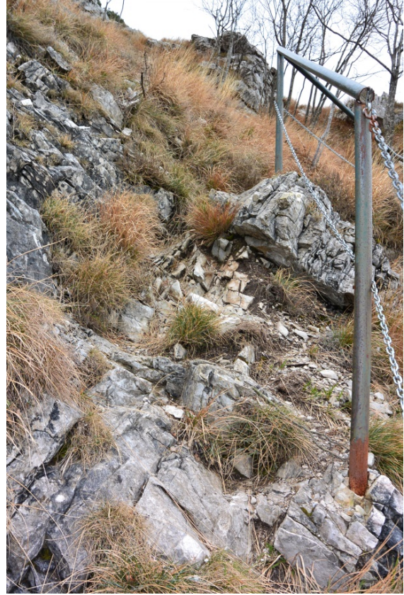
Foto 5 e 6 - Tratti di sentiero ripidi e dissestati lungo l'itinerario di visita in salita