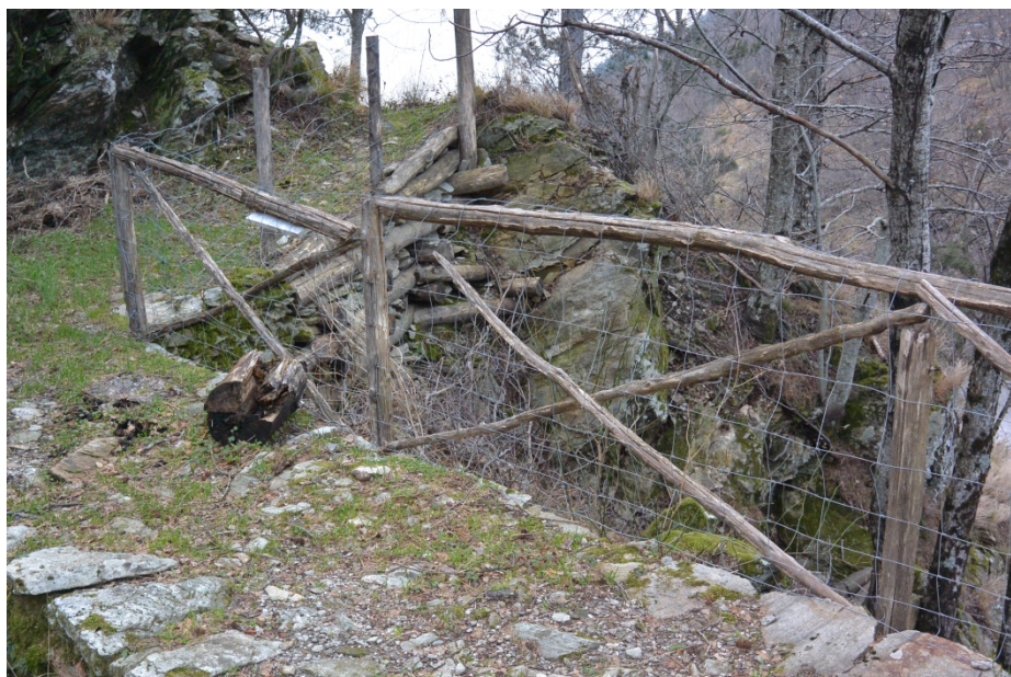
Foto11. Tratto di staccionata in prossimità della zona umida