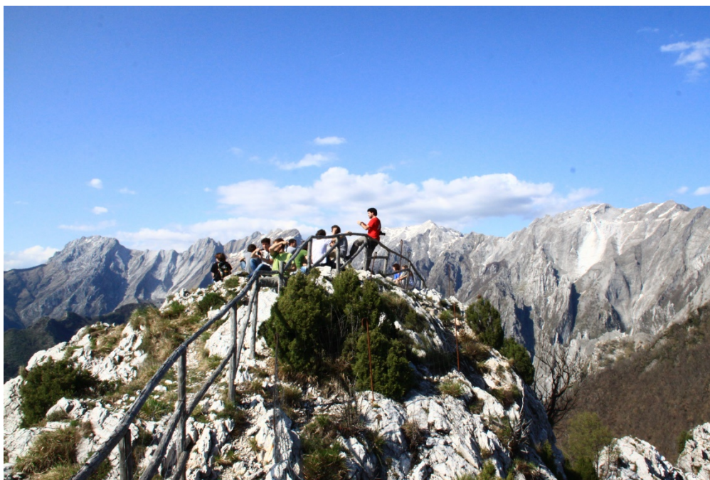
Foto 2. Tratto sommitale dell'Orto Botanico