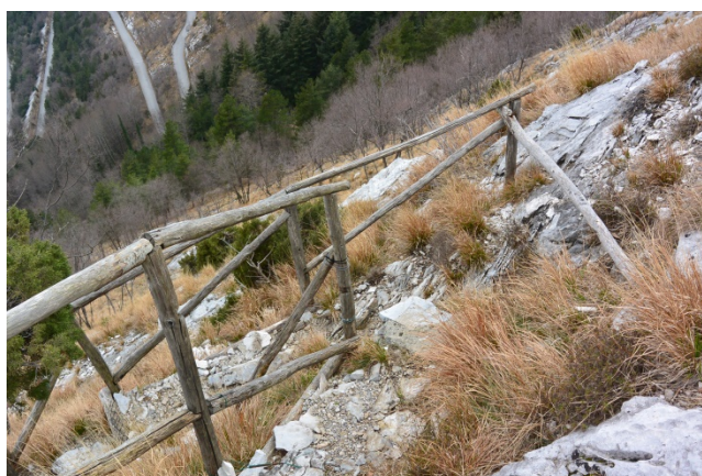
Foto 9. Tratto di staccionata degradato lungo il percorso