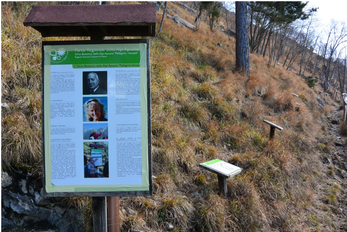
Foto 6. Confronto tra pannelli sul percorso ad accesso facilitato e lungo l'itinerario di visita guidata