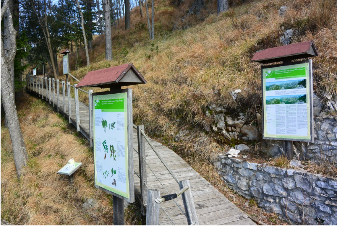
Foto 5. Tipologia di pannelli posti lungo il percorso ad accesso facilitato