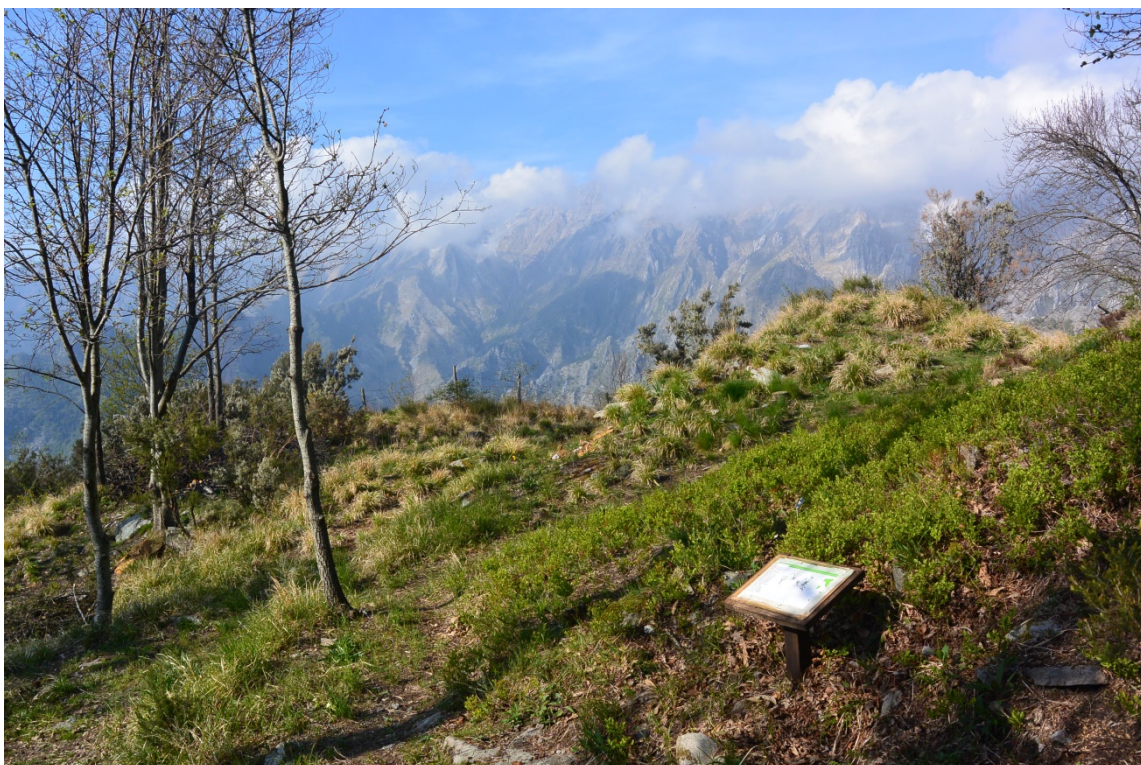
Foto 7. Tipologia di pannello riportante le indicazioni delle specie vegetali presente