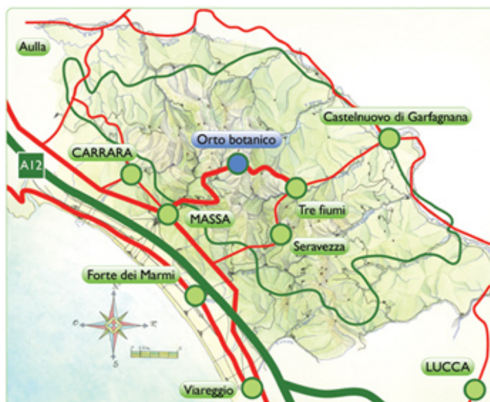
Figura 3. Localizzazione dell'Orto Botanico nel Parco delle Alpi Apuane

L'Orto Botanico è stato istituito nel 1966 e da allora si occupa di portare avanti le sue principali funzioni che sono la conservazione e la divulgazione al pubblico dell'ingente patrimonio floristico apuano; si trova a Pian della Fioba, nel Comune di Massa, a circa 900 m s.l.m. e vista la localizzazione strategica all'interno dell'area parco è facilmente raggiungibile sia da Massa sia dalla Garfagnana e dall'Alta Versilia.