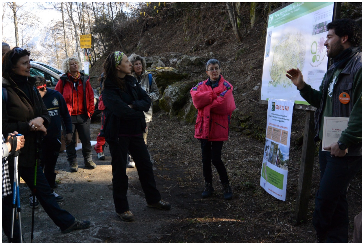
Foto 4 Il pannello illustrativo nel piazzale di Pian della Fioba