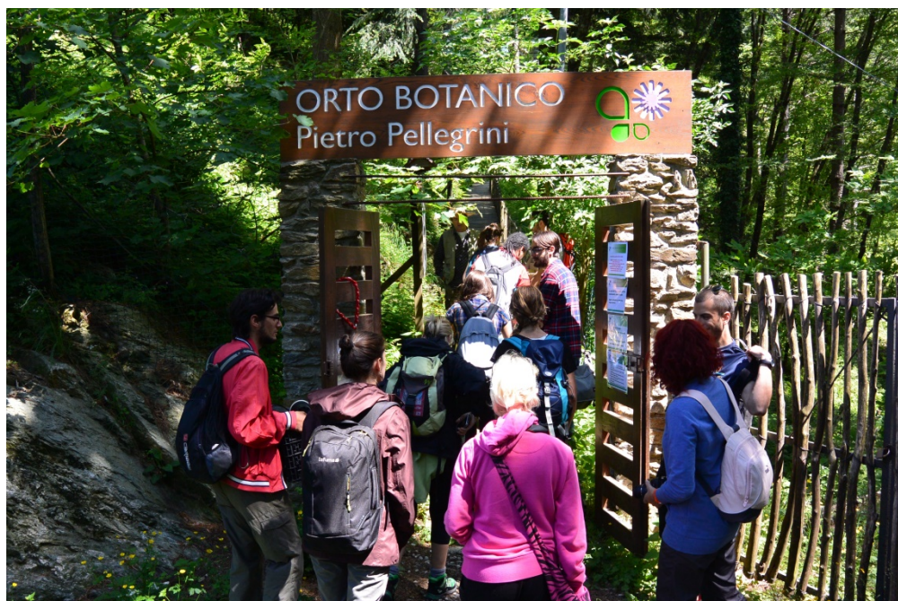
Foto 1. Ingresso dell'Orto Botanico nel piazzale di Pian della Fioba

Aggiornamento dei pannelli divulgativo-didattici lungo il sentiero dell'Orto Botanico delle Alpi Apuane "Pellegrini-Ansaldi", a Pian della Fioba (MS).