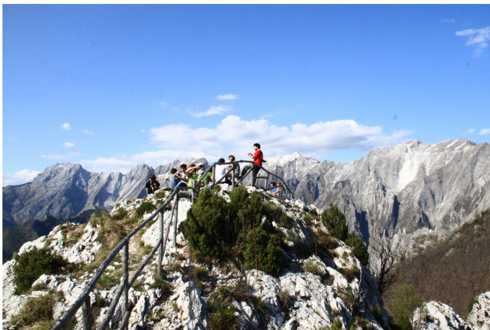
Foto 2. Tratto sommitale dell'Orto Botanico