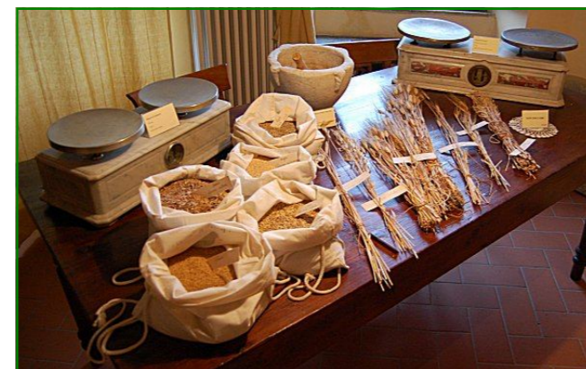
sala “pietre di casa e di bottega” - room “stones for houses and workshops” (locus alchemicus) primo piano del Museo - first floor of Museum