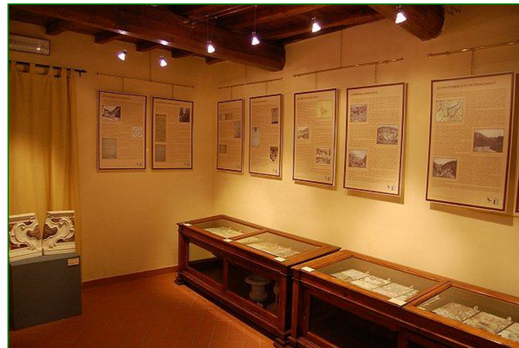
sala “i colori del marmo” room “the colours of marble” (luxuriosa materia) primo piano del Museo first floor of Museum

Il Museo della Pietra piegata – voluto e pensato dall’Ente Parco Regionale delle Alpi Apuane – è stato aperto al pubblico il 31 maggio 2008. L’istituzione ha sede a Levigliani di Stazzema (Lucca) in un edificio di valore storico-ambientale della fine del XVIII sec., che ha subito una radicale ristrutturazione ed ampliamento nel 1910. L’allestimento si sviluppa sui quattro piani dell’intero fabbricato.