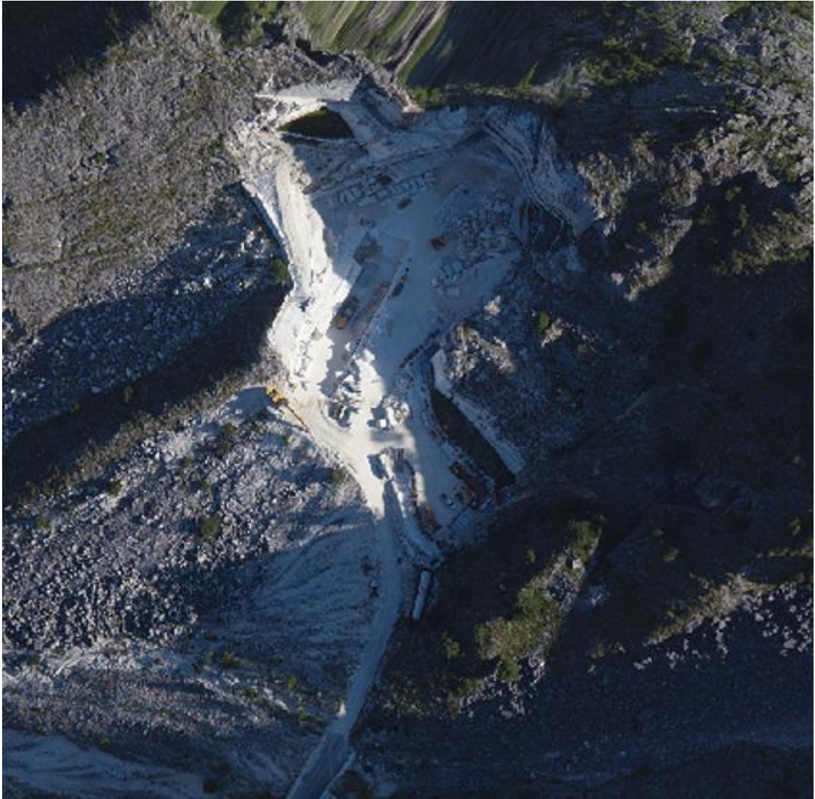
ORTOFOTO AREA DI CAVA VALSORA-PALAZZOLO - M72