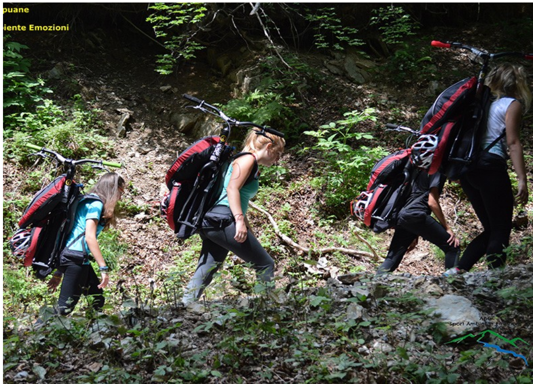
Fig-1: Il modello a disposizione è il BackC6 (peso complessivo back+zaino kg.5),