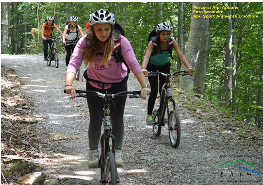
Fig.2_ Nel nostro progetto saranno particolarmente utili per far rientro alla base dopo il tramonto, sfruttando la luce ancora presente dopo il calare del sole

Questo strumento innovativo permette di percorrere i sentieri in salita camminando (con bici riposta in un comodo zaino) e ridiscendere su percorsi ciclabili (piste battute e forestali) in pochi minuti